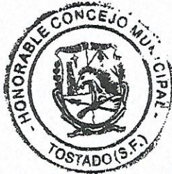
MIGUEL A. ROSALES PRESIDENTE Honorable Concejo Municipal Ciudad de Tostado